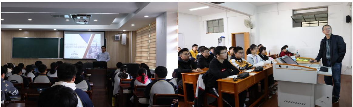
图 14 各专业学生参加职业生涯规划讲座

学校为帮助各个专业的学生深入了解所学专业 and 就业前景，早一步规划职业生涯、树立专业自信明确奋斗目标，组织了一系列职业生涯规划讲座。