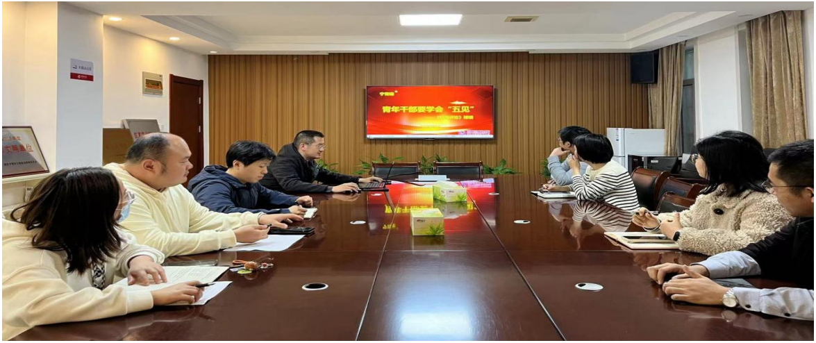
图 19 “青苗培优”团队开展学习心得交流分享会