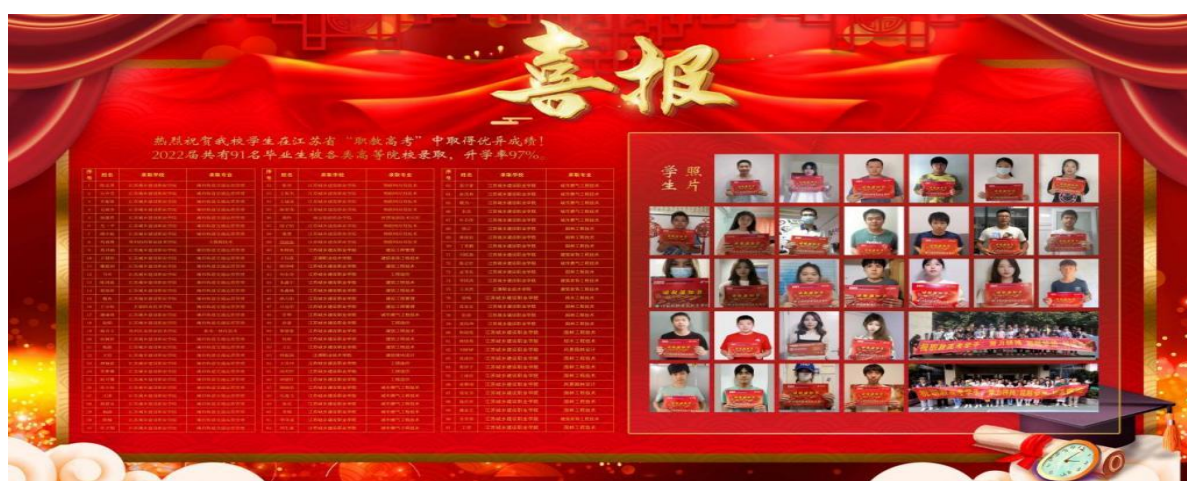
图 16 19 级学生职教高考录取情况