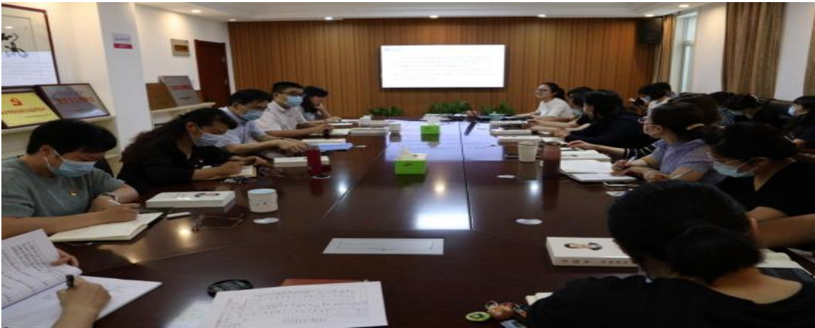
图 20 开展“育建宁 先锋行之‘青·廉’”活动