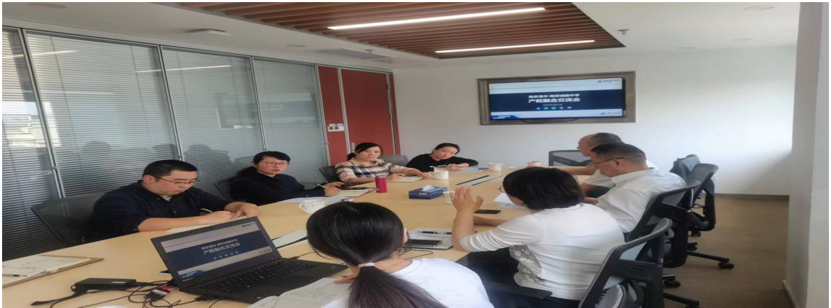
图 24 学校与南京港华进行产教融合交流会