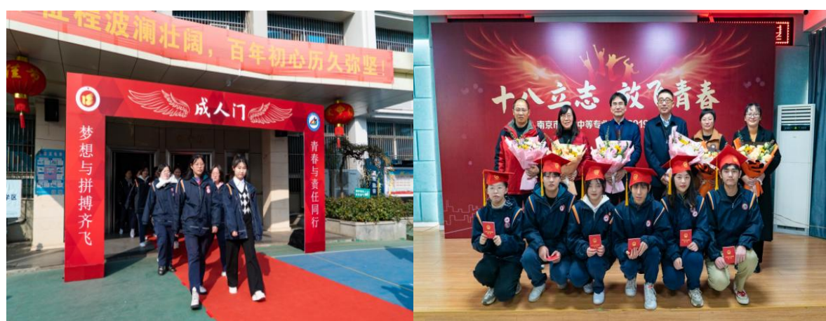
图 3 “十八立志 放飞青春”成人礼活动