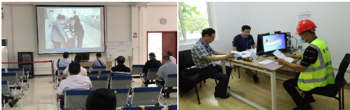
图 29 特种作业考核现场