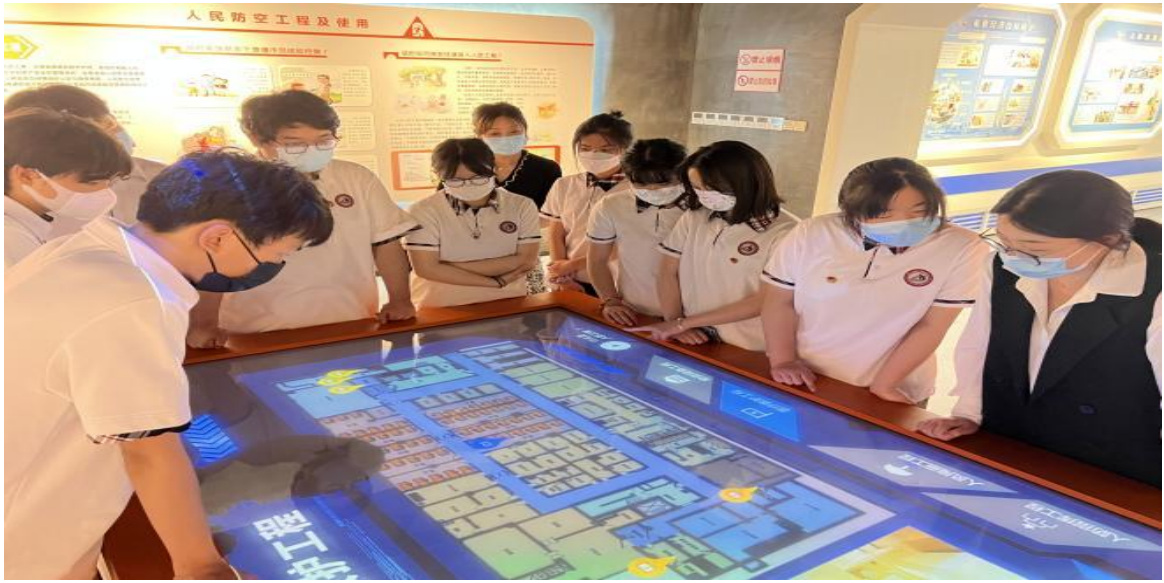
图 13 志愿队参观防空工程