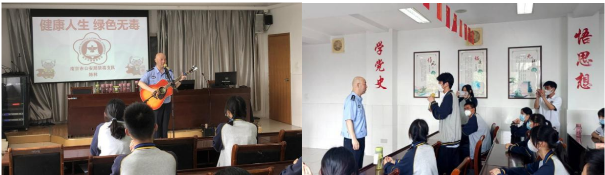
图 5 开展禁毒知识教育讲座