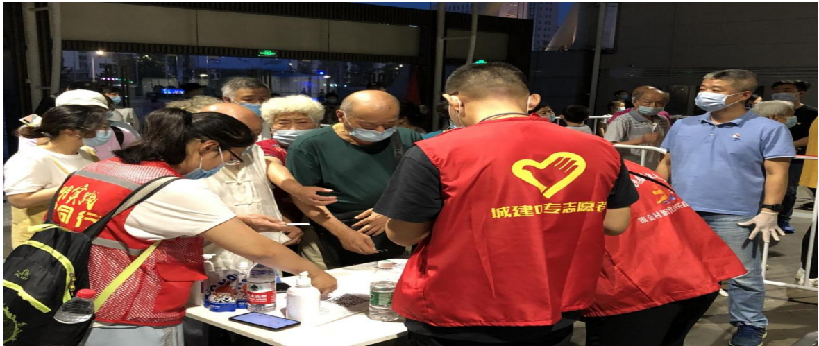
图 35 党员志愿者在一线