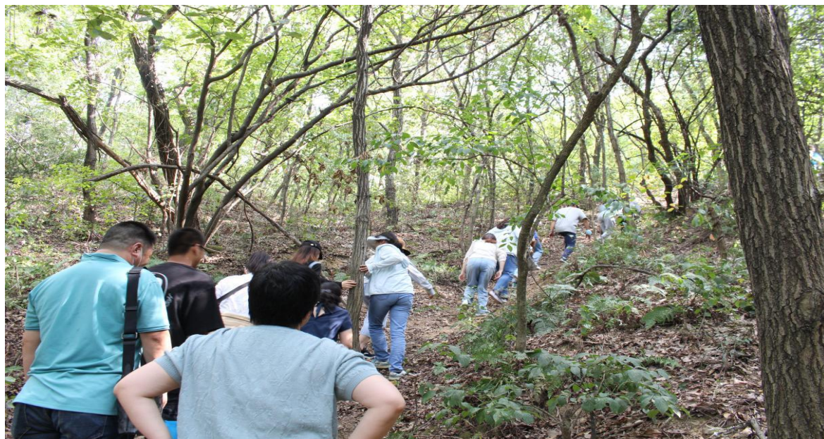
图 37 团建“重走长征路”环节

进了教职工之间的沟通与了解，增强了大家的团队意识，提升了大家的合作能力。全体教职工将以革命先辈为榜样，坚定理想信念，不忘初心、牢记使命；在工作中大力弘扬长征精神，攻坚克难，为学校工作再上新台阶作出新的贡献。