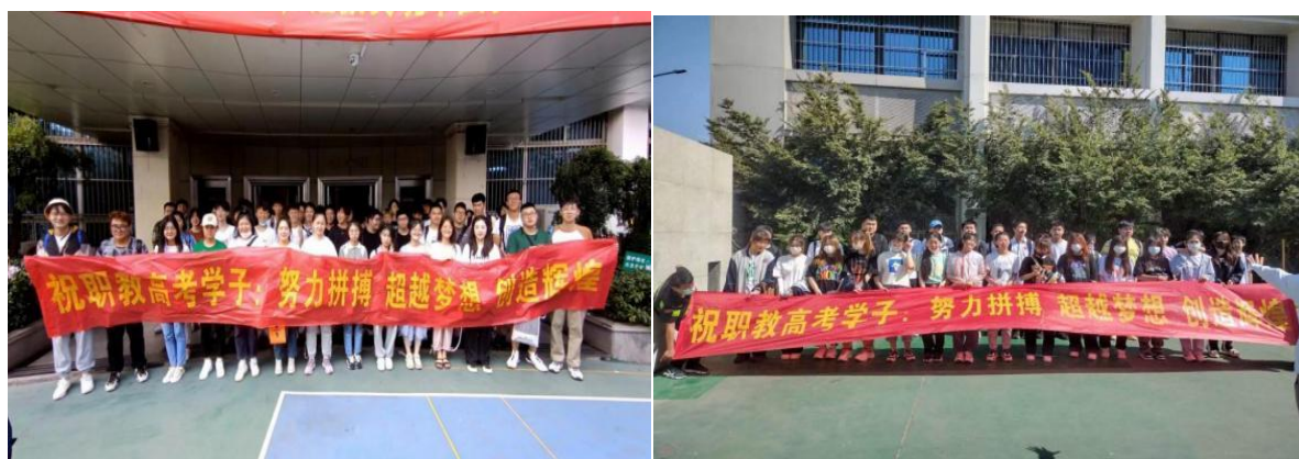
图 15 学校组织 19 级学生参加职教高考

步期，学校抓住政策机遇，与对口高校建立联系，大力宣传引导，积极鼓励 19 级毕业班学生报名，细致做好报名、考试、志愿填报、录取等各阶段的工作。同时开展考试教研，逐步总结积累备考经验。经过综合努力，学校报名人数 94 人，升学人数 91 人，升学率 97%，被公办高校录取率 96%（2 人未毕业，2 人直接就业）。在首次举行的国家职教高考中顺利取得了开门红，标志着学校将正式实现从“以就业为中心”向“以就业升学为中心”的转型，广泛赢得了家长和学生的肯定和赞誉。