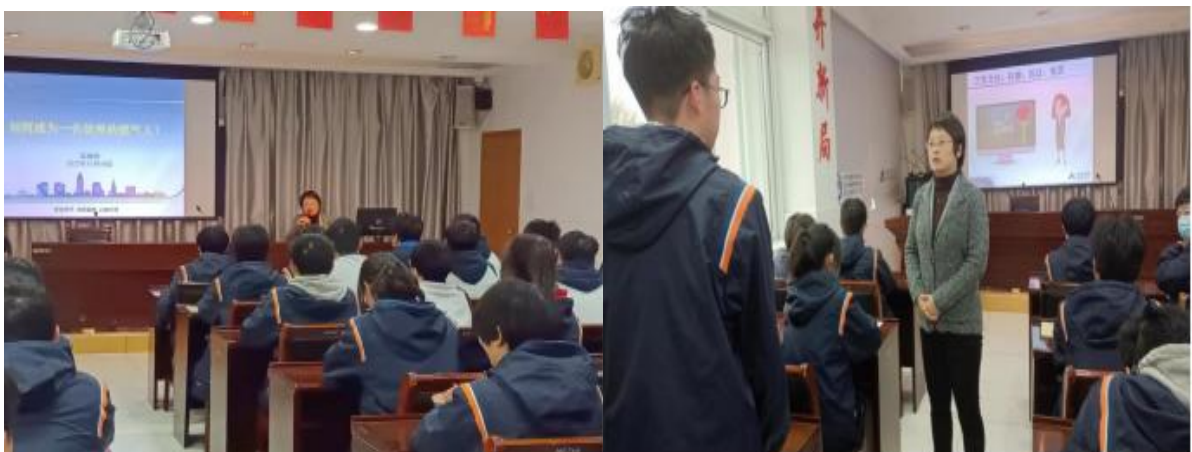
图 25 港华燃气专家为新生开展职业生涯规划讲座、讲解企业“三礼”文化