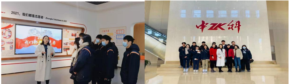
图 6 开展市场营销社会实践活动