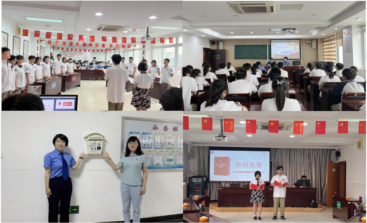
图 4 开展“民法典进校园”系列活动