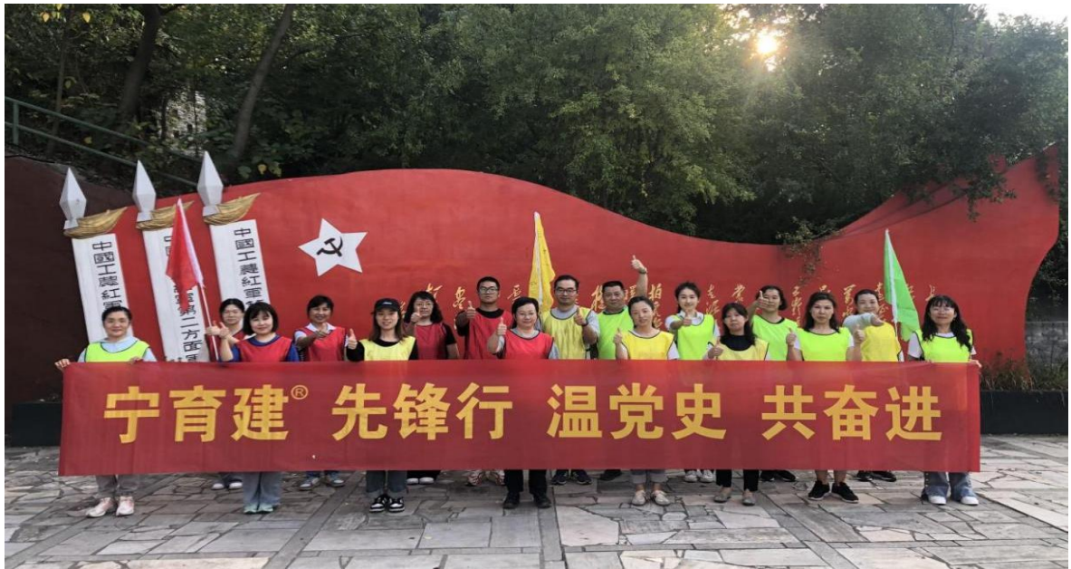
图 39 开展“宁育建 先锋行 温党史 共奋进”主题团建活动合影