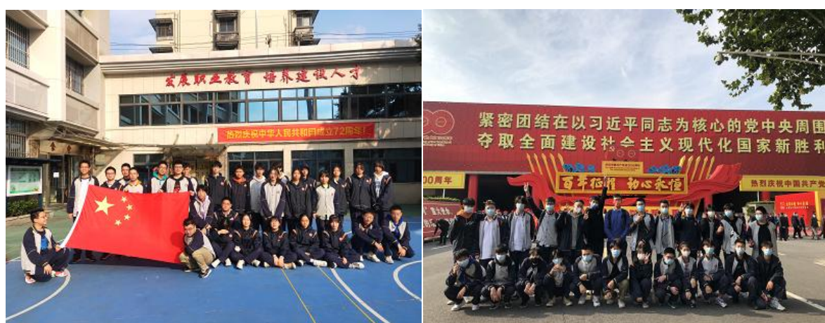
图 2 开展“弘扬民族精神 奏响爱国乐章”爱国主义教育活动

《众志成城，驱除病疫》两个作品荣获三等奖。在南京市职业学校“培根铸魂提素养,丹心喜迎二十大”电子小报比赛中,《城建青年报》荣获一等奖;《跟党走,奋斗新征程》、《强国有青年》荣获二等奖;《喜迎二十大,奋进向未来》荣获三等奖。学校以赛促教、以赛促学,努力营造“人人皆可成才、人人尽展其才”的良好环境,严格落实立德树人根本任务。