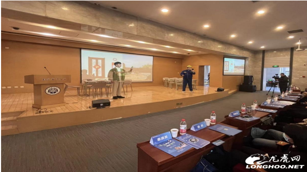
图 10 学生在高校表演法制情景剧