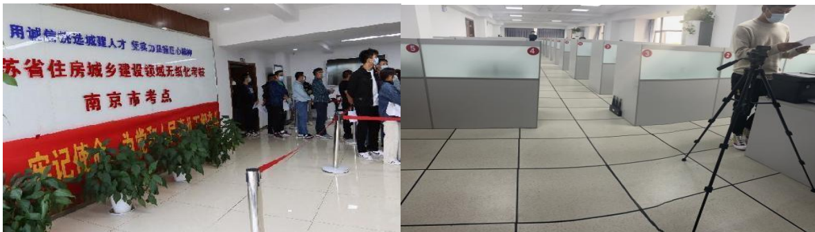
图 28 三类人员考核现场

一年来，基地完成南京市考核约 42000 人次。其中安全管理三类人员考核人数 19032 人次、特种作业考核人数 21548 人次、燃气从业人员考核人数 567 人次。