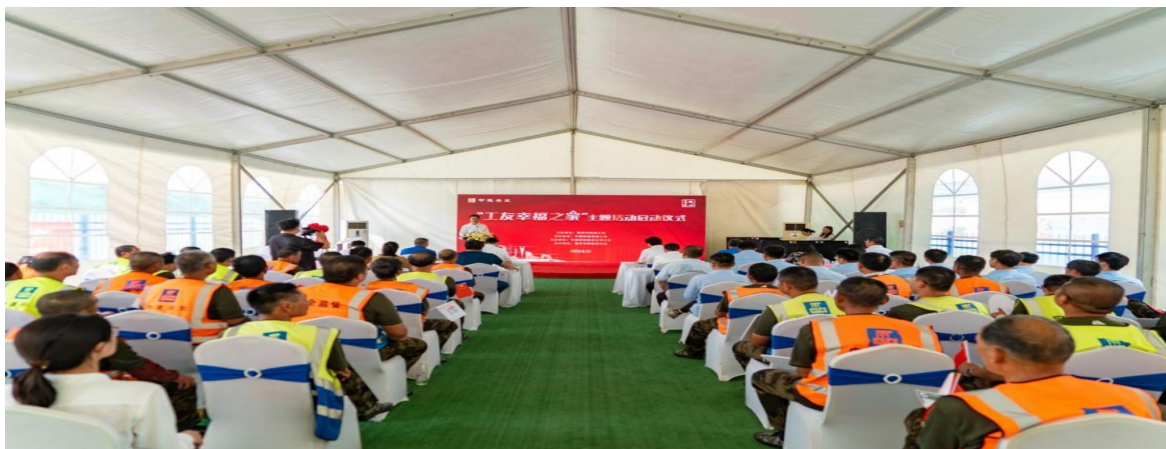
图 30 “工友幸福之家”启动仪式