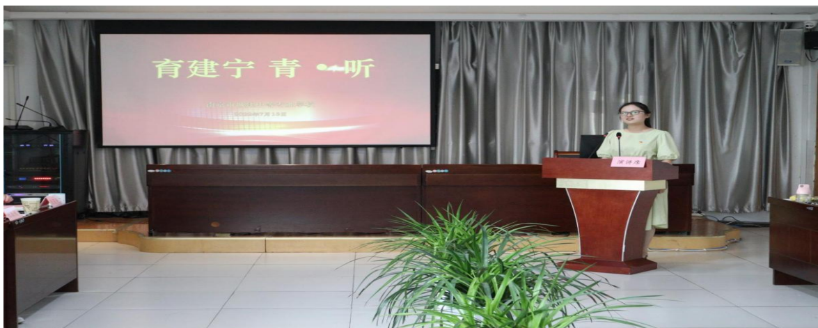
图 21 开展“育建宁 先锋行之‘青·听’”活动聆听青年教师心声