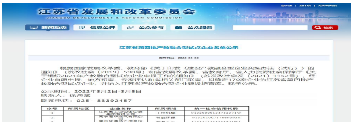
图 22 江苏省第四批产教融合型试点企业名单公示

通过开展合作，也为学校建筑类相关专业，燃气类专业的发展奠定了良好基础，学生订单制长线程培养，学校教学和企业实训结合，校企合作技术攻关等，使学校在职教改革中充分发挥出自身优势，再获发展新机。