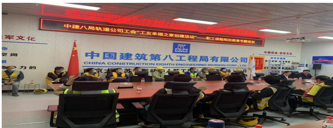
图 32 职工保险知识教育专题培训