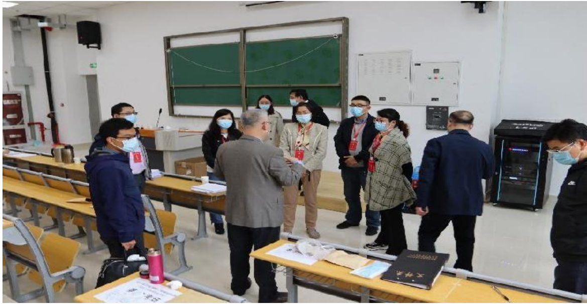
图 27 二级造价师南京考区考试