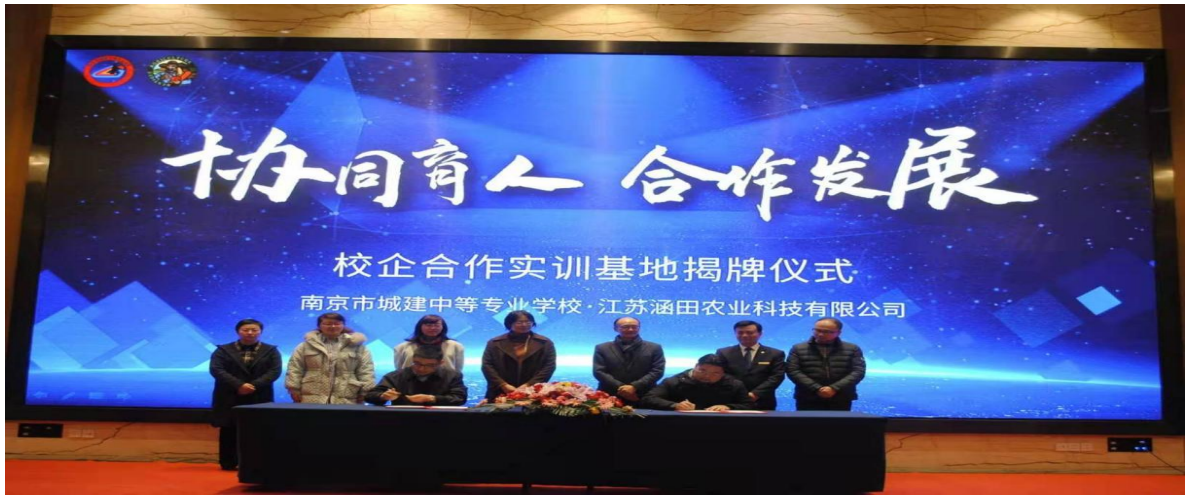
图 23 校企合作实训基地揭牌仪式