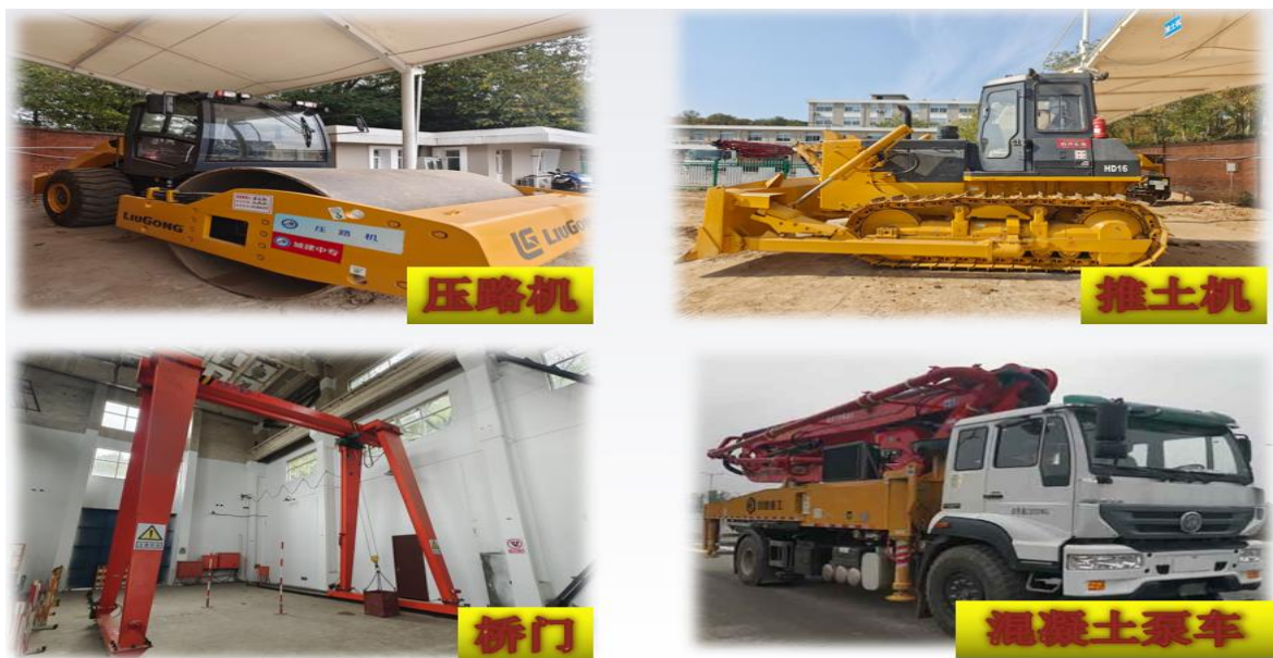
图 26 实操考试场所