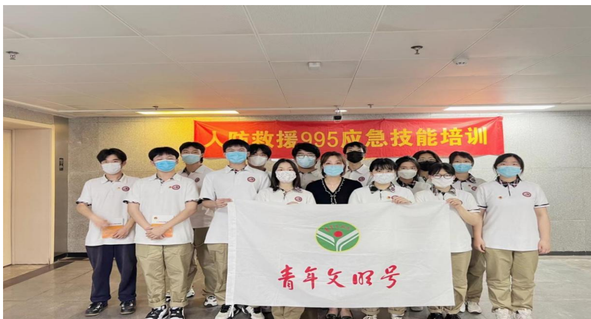
图 11 “风之彩” 志愿者队合影

通过此次活动，队员们进一步加强了对防空防灾知识的了解，更直观地体会到了国防教育和防空防灾知识教育的重要性，以及在和平年代仍要居安思危。