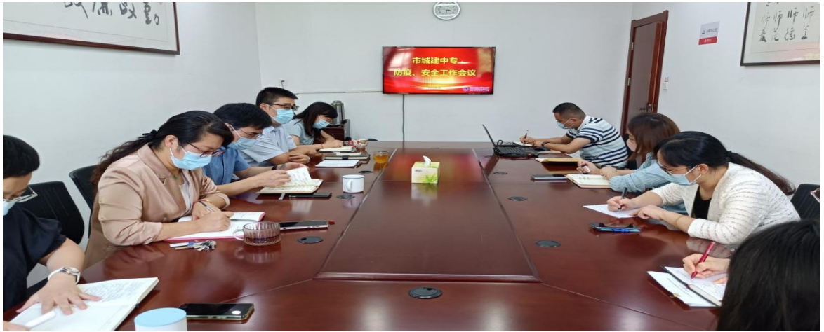
图 34 开展防疫、安全工作会议