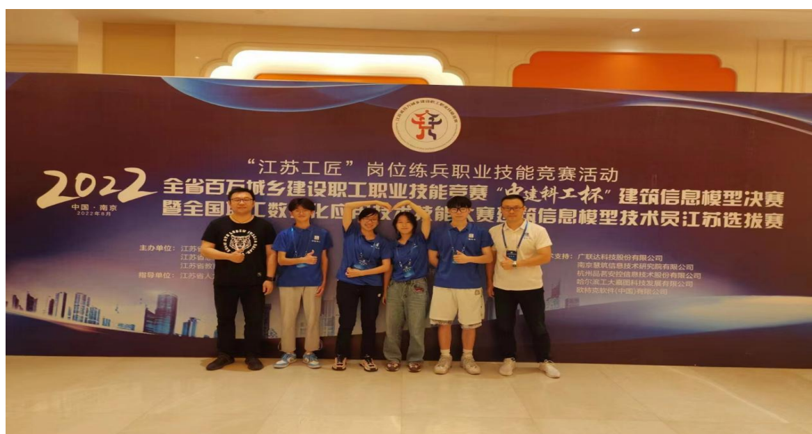
图 17 师生参加 2022 年度江苏省 BIM 技能竞赛

为强化专业知识、提升实操能力以及增强学生心理健康意识，学校今年成立了 BIM 工作室，将理论教学与实训课程有机融合，并积极参与报名各级各类 BIM 比赛，以赛促学、以学促用。学校还建设工程造价、园林绿化专业实训室，并购买 2 款仿真实习实训软件，数字资源覆盖专业及核心课程率 100%、师生信息化应用水平显著提升。