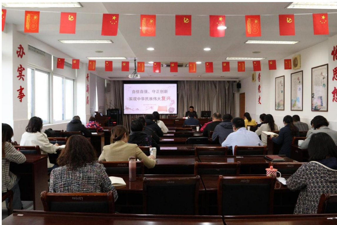
图 1 书记为学校教师上党课

等角度纵览中华民族历史时间轴，并与世界其他文明古国进行横向对比，从地缘、政治、文化等视角分析我国系列重大国家发展战略的历史意义，指出今天我们比历史上任何时期都更接近、更有信心和能力实现中华民族伟大复兴的目标；并领学了习近平总书记在中国共产党第二十次全国代表大会开幕会上的报告，从中国式现代化、实体经济、人才自主培养质量、制度型开放、城乡人居环境整治等经济、民生领域的 23 个关键词，解锁报告中的“变”字密码，为大家带来一堂精彩的专题辅导党课。