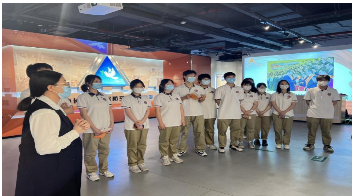
图 12 志愿队参观人防教育馆