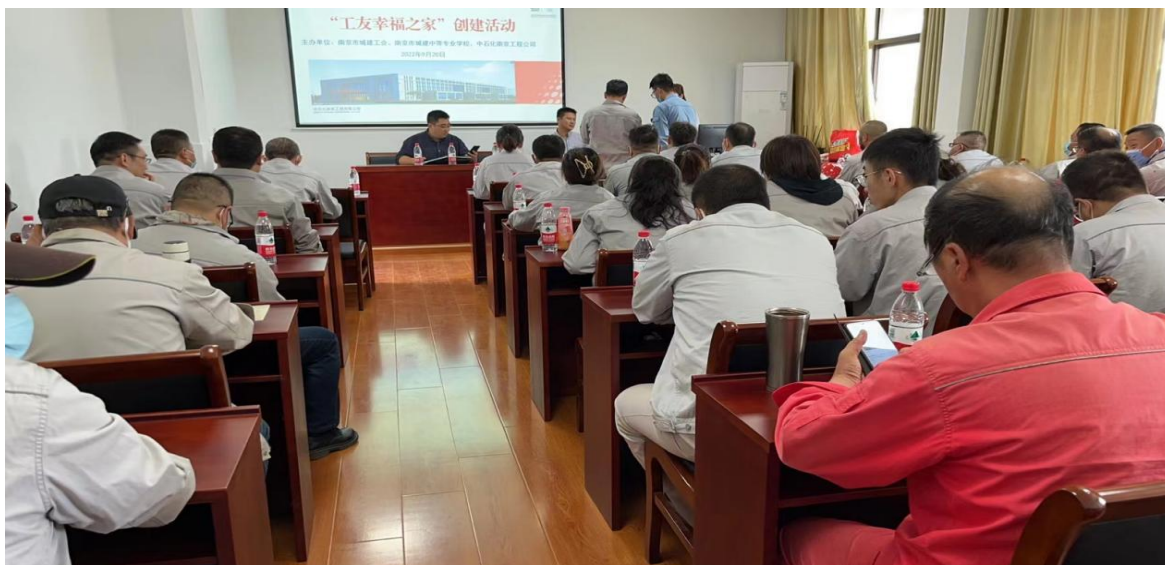
图 33 “工友幸福之家”创建活动