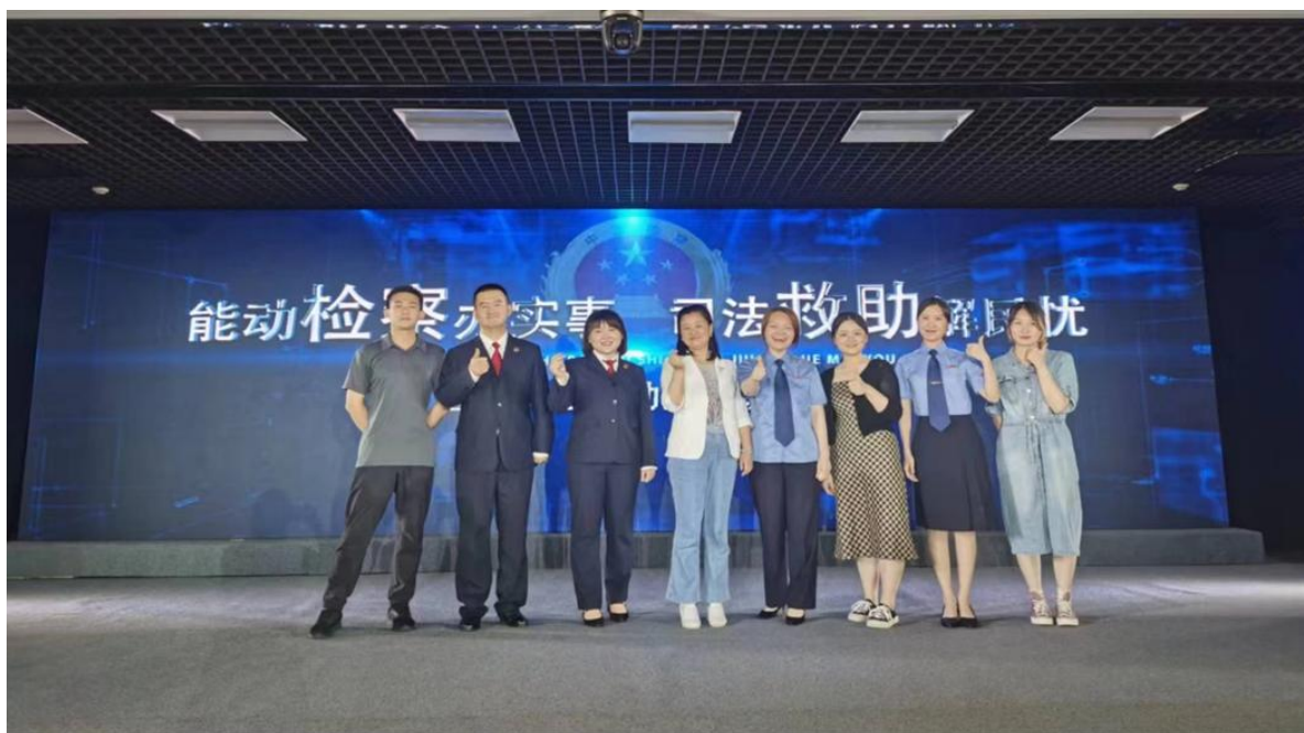
图 9 心理社团参加南京市检察院法制进校园活动表演合影