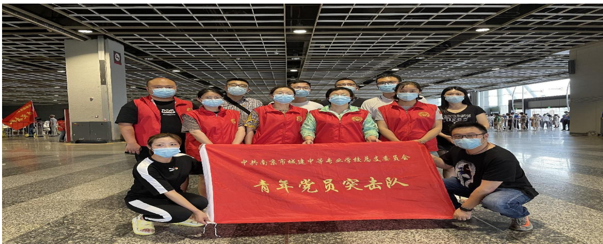
图 36 城建中专青年党员突击队