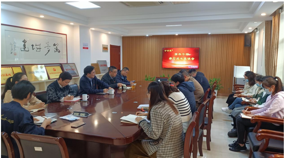
图 18 年轻干部学习成长座谈会

学校加强中层干部队伍建设，只有以培养年轻干部为关键，坚持解放思想，与时俱进，才能以改革创新精神推动青年中层干部队伍建设，为促进学校教育均衡、优质、可持续发展提供强有力的组织保证和人才支撑。