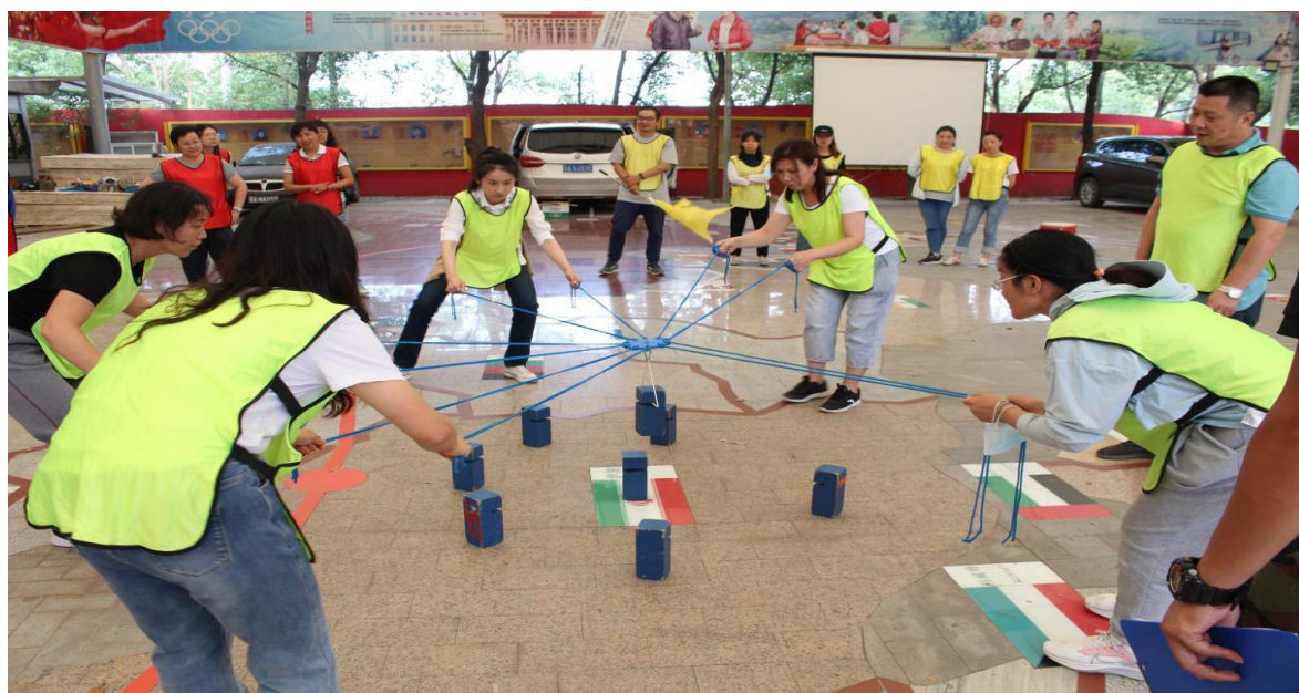
图 38 团队拓展活动